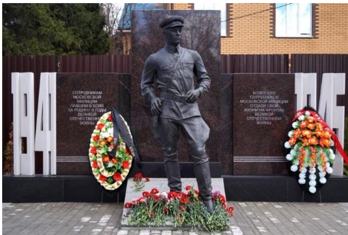
Памятник сотрудникам милиции, погибшим в годы Великой Отечественной войны (Москва, Троицкий административный округ)

В Троицком административном округе Москвы расположен памятник московским милиционерам, погибшим во время Великой Отечественной войны 1 . Из рядов московской милиции на фронт было отправлено несколько тысяч сотрудников.