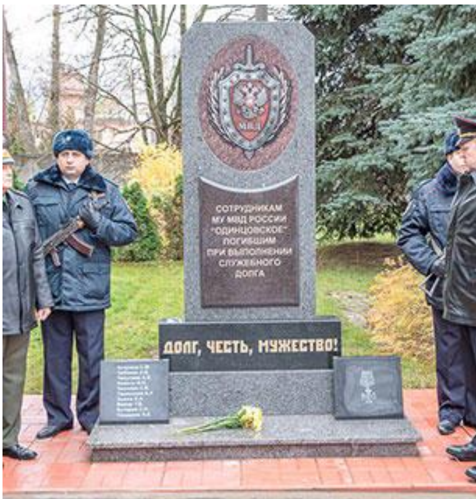
Памятник сотрудникам, погибшим при выполнении служебного долга (Одинцово)

Памятник сотрудникам полиции, погибшим при исполнении служебного долга, был открыт в Одинцово (Московская область) 4 .