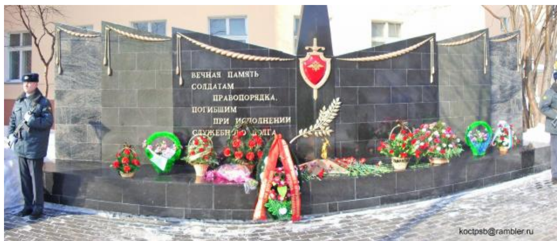
Мемориальный комплекс, посвященный сотрудникам органов внутренних дел, погибшим при исполнении служебного долга в годы Великой Отечественной войны и мирное время (Мурманск)

На Северо-Западе России, на территории Мурманской области, 10 ноября 2005 г. был открыт мемориальный комплекс в честь сотрудников органов внутренних дел, погибших при исполнении служебного и воинского долга в годы Великой Отечественной войны и мирное время 2 .