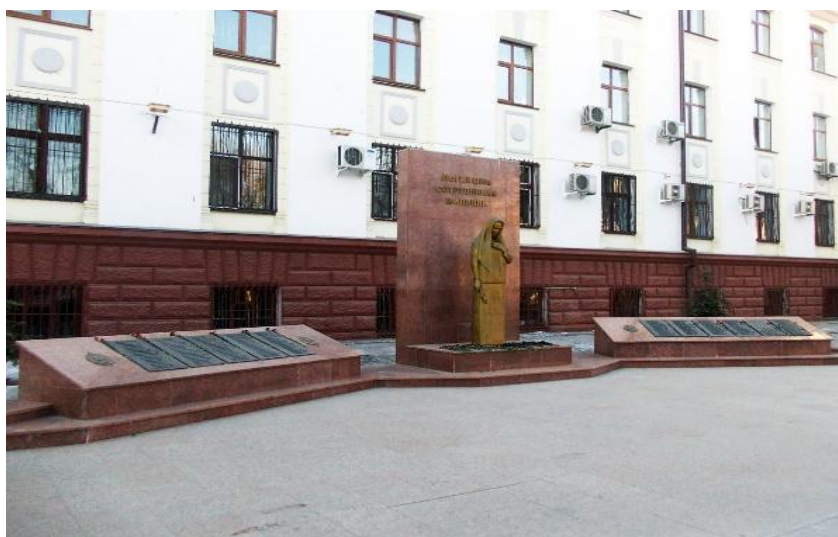
Мемориал памяти сотрудникам органов внутренних дел, погибшим при исполнении служебного долга (Тюмень)

Впервые идея увековечить память о погибших сотрудниках милиции появилась в 2007 г. По инициативе общественной организации ветеранов войны и органов внутренних дел была проведена большая работа по анализу архивных документов. Было найдено 173 имени героев, в число которых вошли 49 участников Великой Отечественной войны. Постройка мемориала осуществлялась за счет средств сотрудников милиции, родственников погибших сотрудников милиции, частных охранных фирм, различных предприятий и граждан. Памятник был торжественно открыт 7 мая в 2010 г.