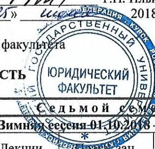
ГРАФИК учебного процесса студентов ЧЕТВЕРТОГО курса ЗАОЧНОЙ формы обучения юридического факультета Направление подготовки 40.03.01 ЮРИСПРУДЕНЦИЯ Профиль: СУДЕБНАЯ, ПРАВООХРАНИТЕЛЬНАЯ И АДВОКАТСКАЯ ДЕЯТЕЛЬНОСТЬ Срок обучения: 3 года 6 месяцев