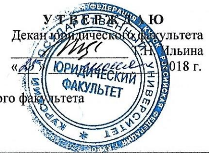
ГРАФИК учебного процесса студентов ТРЕТЬЕГО курса ЗАОЧНОЙ формы обучения юридического факультета Направление подготовки 40.03.01 ЮРИСПРУДЕНЦИЯ Профиль: УГОЛОВНОЕ ПРАВО И УГОЛОВНЫЙ ПРОЦЕСС Срок обучения: 4 года 6 месяцев