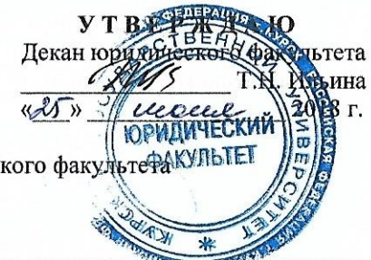
ГРАФИК учебного процесса студентов ЧЕТВЕРТОГО курса ЗАОЧНОЙ формы обучения юридического факультета Направление подготовки 40.03.01 ЮРИСПРУДЕНЦИЯ Профиль: УГОЛОВНОЕ ПРАВО И УГОЛОВНЫЙ ПРОЦЕСС Срок обучения: 3 года 6 месяцев